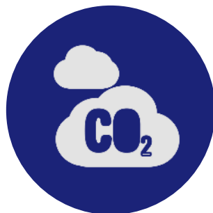
מענקי לכידת פחמן

גובה המענקים יהיה בהתאם לגובה מיסוי הפחמן, כך שאם מפעל לוכד את גזי החממה שהוא פלט, הוא לא יהיה ממוסה בשיעור החיסכון שנוצר בפליטה שלו כתוצאה מלכידת הפחמן